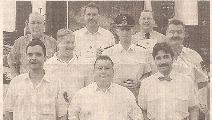
Sie bekamen beim sonntäglichen Festkommers im schmucken Festzelt das Silberne Verdienstkreuz.